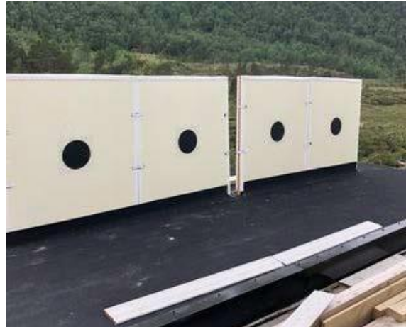
Halsa skytterlag- skiver 100m med nytt tak