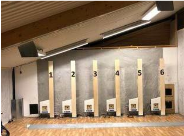
Ørnes skytterlag - nye optiske skiver innendørs