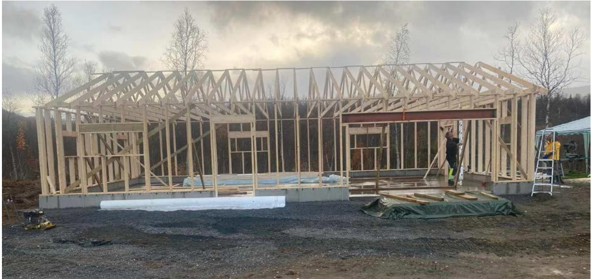
Sulitjelma - nytt lager og toalettbygg