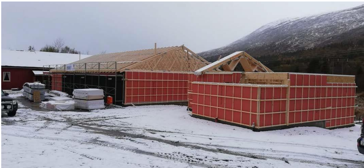
Valnesfjord skytterlag – ny standplass og innendørsbane

Thor-Arne Tobiassen Banekontakt nov 2023